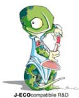
J-ECO COMPATIBLE R&D

Compatibilitate: Cernelurile J-Teck lucreaza perfect cu toate capetele de printare piezo si cu marea majoritate a mediilor de printare pentru dye-sublimare.